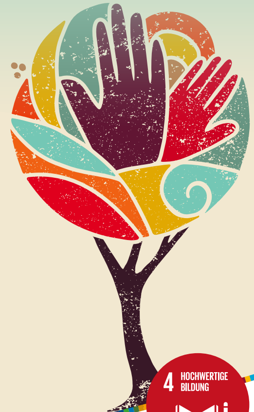
Cover Illustration, Foto: stock.adobe.com